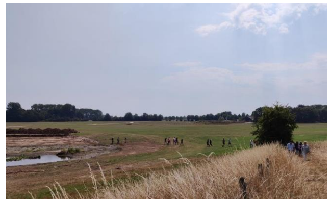
2 Wandelaars lopen door het projectgebied over de dijkopgang richting Boerderijcamping de Hank

Woensdag 20 juli vond de geïnteresseerdenwandeling plaats. Op deze zomerse dag hebben wij met zo'n 45 omwonenden en geïnteresseerden een wandeling van circa twee uur door het zuidelijk deel van het projectgebied gemaakt. Meerdere deskundigen gaven de wandelaars aan de hand van hun enthousiaste verhalen een goed beeld van de interessante onderwerpen waar wij als aannemer mee te maken krijgen tijdens de werkzaamheden. Er is een toelichting gegeven door de verschillende deskundigen op het gebied van archeologie, 2 e wereldoorlog historie (relevant voor de explosievenopsporing), munitiedetectie en -opsporing en ecologie.