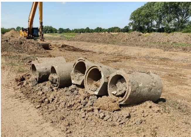
1 Verwijderde duikeronderdelen