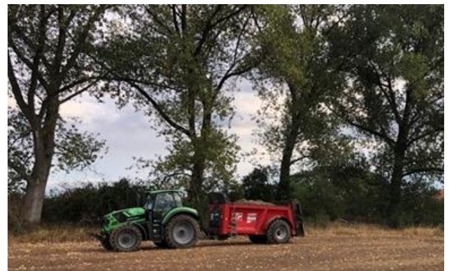
2 Gras wordt over de natuurcompensatiegebieden uitgestrooid

Een van de onderdelen van het werk is de natuurcompensatie ViA15. Op een speciaal daarvoor aangewezen gebied, hebben we in de afgelopen periode de toplaag afgegraven, vervangen door een wat meer humeuze grondlaag (bouwvoor) uit het meest nabij gelegen maaiveldverlagingengebied en maaisels van stroomdalgrasland en glanshaverhooiland ingezaaid. Dit zijn graslanden die kenmerkend zijn voor de uiterwaarden in Nederland.