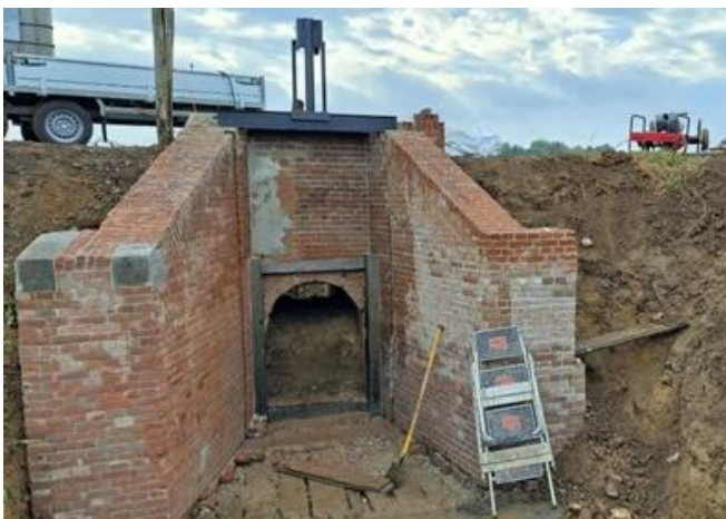
1 Renovatiewerkzaamheden sluisje Spaanse Schans

Begin september zijn we begonnen met het renoveren van het sluisje bij de Spaanse Schans. Daarbij is het metselwerk gerestaureerd, de schuif om de sluis af te sluiten vervangen en het bewegingswerk geconserveerd en weer bruikbaar gemaakt. Verder hebben we houten damwanden geplaatst voor een goede doorstroming van de sluis.