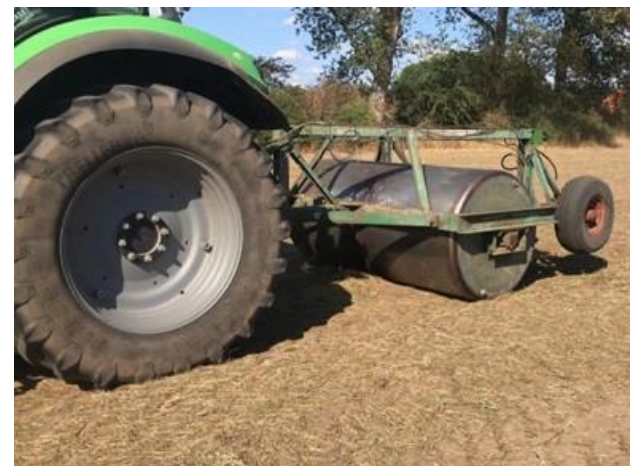
3 Middels een grondwals wordt het uitgestrooide gras in de grond gewalst.