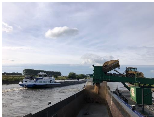
3 Dumper loost grond in schip middels overslagponton