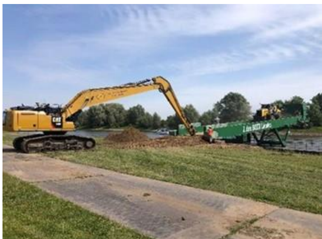
4 Overslagponton wordt geïnstalleerd