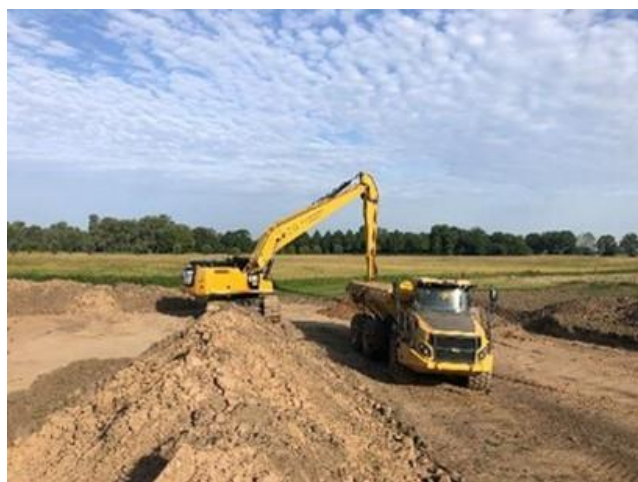
2 Kraanmachine laadt dumper met grond