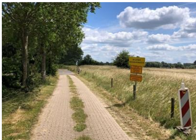
1 Kruising Weg naar het Ganzen Ei met verkeersmaatregelen

De grond transporteren we af via een vaste route binnen het gebied naar de losvoorziening aan de IJssel. Deze transportroute kruist de Weg naar Het Ganzen Ei. Om de veiligheid te waarborgen zijn enkele verkeersmaatregelen geplaatst, zoals bebording en geleidingschildjes.