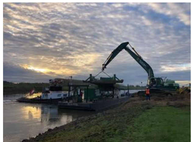
De overslagponton wordt gereed gemaakt voor verplaatsing van de zuidlocatie naar de noordlocatie