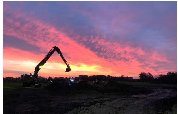
Laatste graafwerkzaamheden zuidkant, bij zonsopgang

Als onderdeel van het verbeteren van de waterbeheersing in het gebied, hebben we aan de zuidkant twee duikers (buizen om water mee aan of af te voeren) verwijderd. We hebben een oude betonnen duiker verwijderd, welke in de nieuwe situatie overbodig is. Daarnaast wordt een kleine duiker van PVC vervangen door een grotere betonnen buis met een zogeheten terugslagklep, die de waterinlaat in het gebied beter helpt te reguleren. Tevens is er een betonblokkenmat geplaatst in een dieper gelegen deel van de maaiveldverlaging zodat tractoren dit dieper gelegen deel veilig kunnen passeren, zonder het maaiveld te beschadigen.