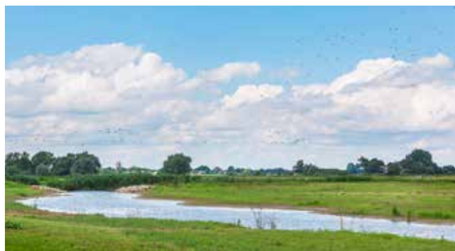
Een kleine geul in de uiterwaard

We onderzoeken de mogelijkheden voor een geul die altijd meestroomt met de rivier en kleinere geulen die aan één kant verbonden zijn met de rivier. Ook willen we weiland omvormen naar natuurlijk grasland. Daarnaast verkennen we de mogelijkheden om oobos terug te brengen in de uiterwaarden. Dat doen we alleen op plekken waar dat niet voor een opstuwung bij hoog water zorgt. Hiermee voeren we Europese en nationale regels uit die zorgen voor natuurontwikkeling en -bescherming, schoon en gezond water en verbinding tussen de natuurgebieden. Aan hoogwaterveiligheid doen we geen concessies.