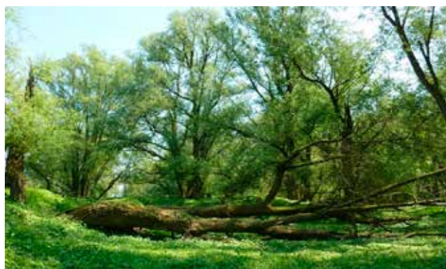
Oobos in de uiterwaard